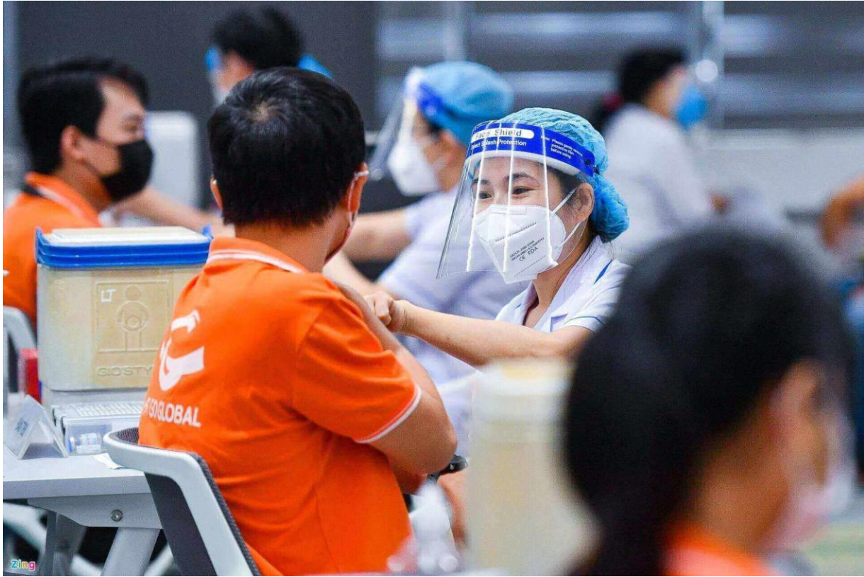
ワクチン接種を受ける FPT の従業員（2021 年 6 月）